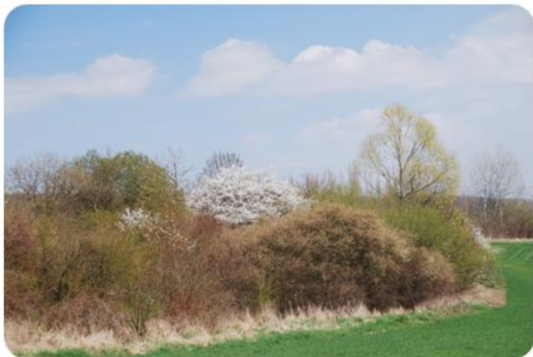
Kvetly vrby a trnky

Napsal uživatel Václav Petříček Pondělí, 04 Červen 2012 06:37