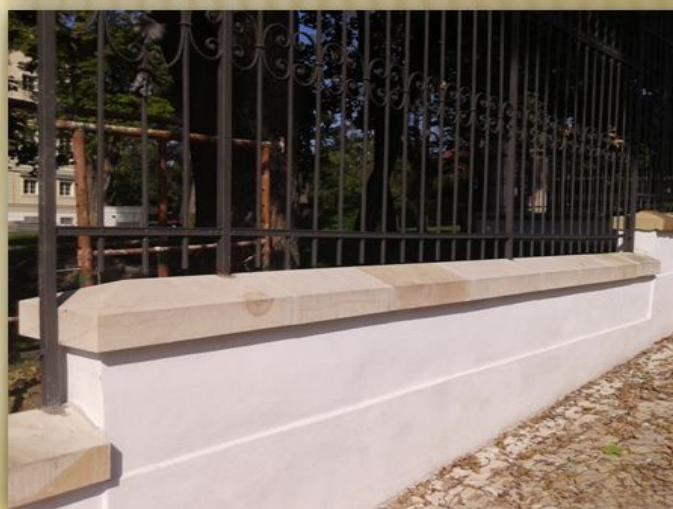
FOTO:3: Východní úsek zdi prvního oddělení obecního hřbitova v Tesařské ulici z 19. stol.